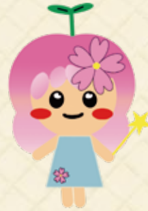
就活応援キャラクター さくらこちゃん

〒024-8520 岩手県北上市芳町2-8 北上地区合同庁舎1F (北上市役所隣・ハローワーク北上向かい)