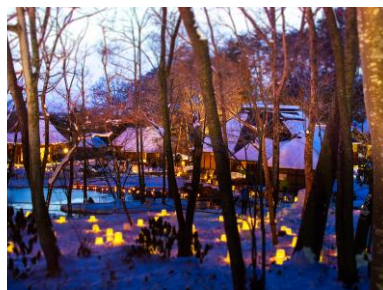
<雪明かりと民俗村の小正月>